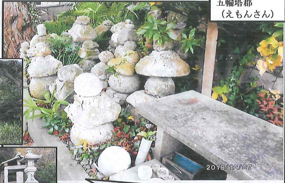
五輪塔郡 (えもんさん)