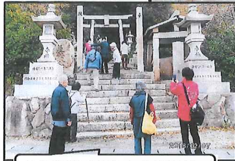
走り御輿で有名な八幡神社