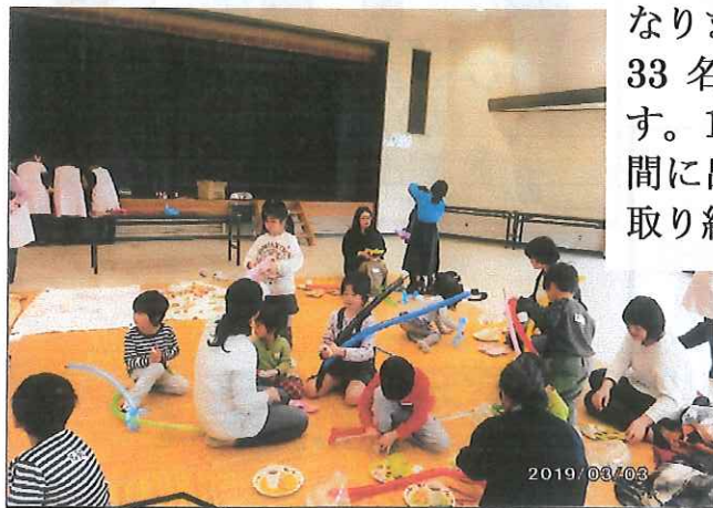
3月3日ふうせん遊びの風景です。

12月9日に第3回 3月3日に第4回「ちびっ子サロン」を開催いたしました。今年度は台風のため第2回のサロンは中止となりましたが、第3回は23名・第4回は33名とたくさんの参加があり喜んでます。1時間30分をどうすれば充実した時間に来るか 毎回スタッフは頑張っており取り組んでいます。