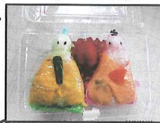
栄養委員さん手作りのお雛さまのおすしのプレゼントがありました。