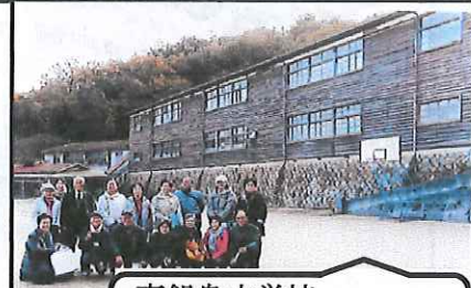
真鍋島中学校 昭和24年建設木造校

長い歴史と人々が培ってきたものは、過疎化と産業の衰退が進んだ現在も、島の中に息づいているようです。