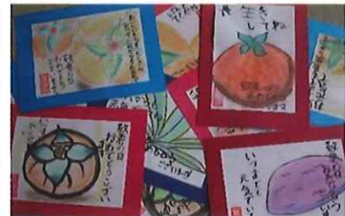
新山小学校児童より敬老者へのお祝い絵手紙贈呈式（9/18）