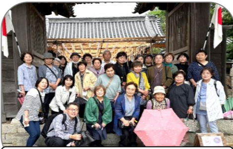
野外カフェも再開 バス旅行(白鳥神社)